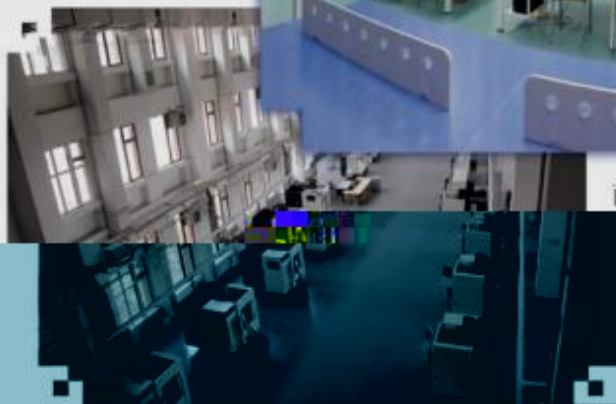
DMG 数控技术训练场所